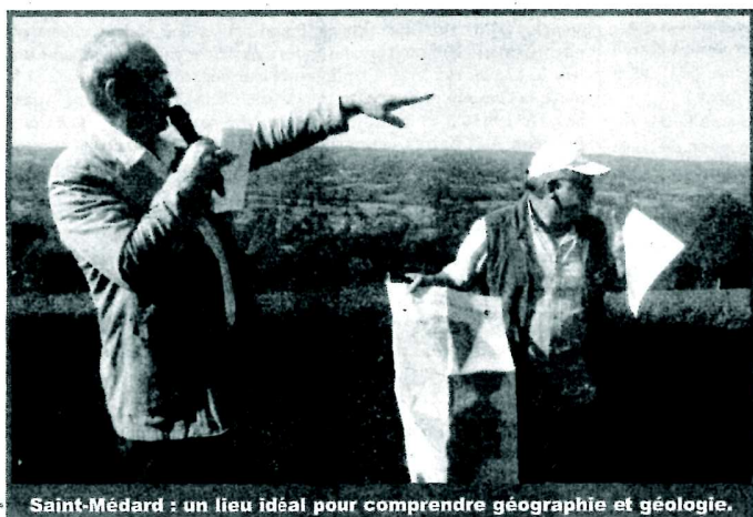
Saint-Médard : un lieu idéal pour comprendre géographie et géologie.