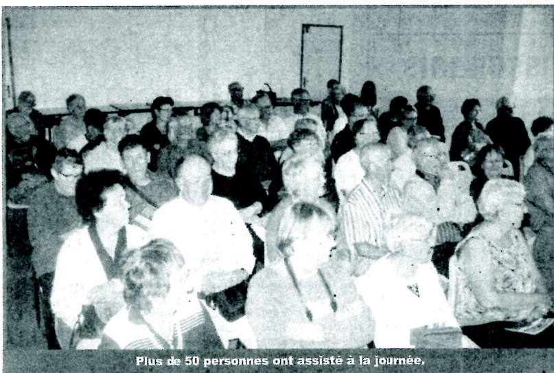
Plus de 50 personnes ont assisté à la journée.

L'association des «Maçons de la Creuse» a été accueillie récemment à Lavaveix-les-Mines et dans la commune de Saint-Médard-la-Rochette. Dans cette dernière, à Lioreix, il s'agissait de revivre les migrations et la vie d'un maçon migrant (XIX e siècle) ancêtre d'un adhérent et de visiter le musée rural privé qui occupe une des maisons de la famille. Arrêt ensuite à Saint-Médard : un superbe panorama, une église bien restaurée et un cimetière qui révèle bien des surprises. A Lavaveix, la municipalité, avec le concours de l'OT d'Ahun, avait bien fait les choses pour une découverte passionnante du patrimoine minier : terrils, ateliers, habitat, bureaux... sans oublier les bâtiments en cours de restauration et les projets innovants.