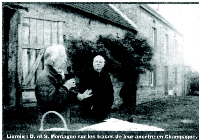
Lioreix : D. et S. Montagne sur les traces de leur ancêtre en Champagne.