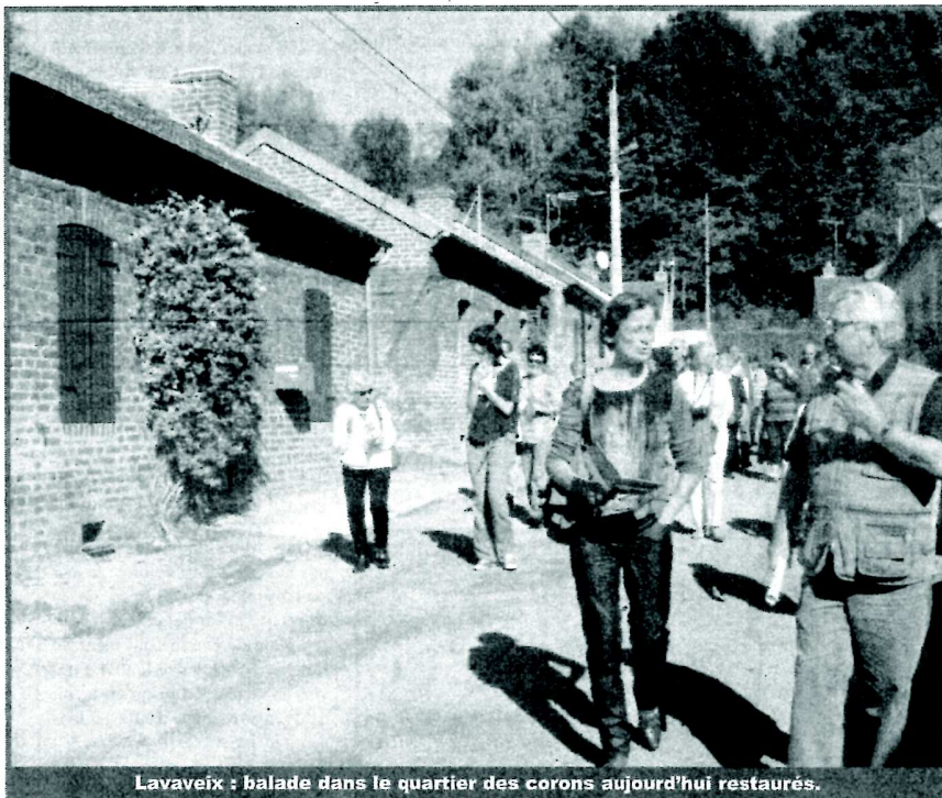
Lavaveix : balade dans le quartier des corons aujourd'hui restaurés.