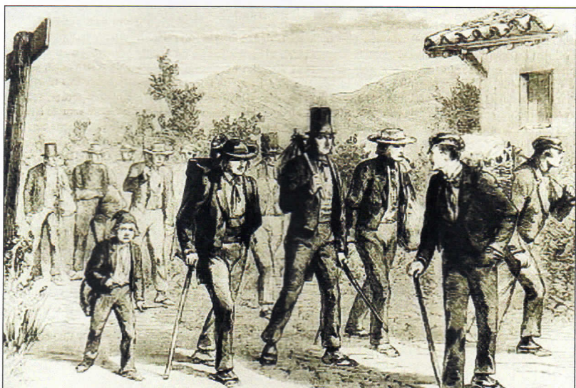
SUR LES CHEMINS. En route vers Lyon, Godefroy, L'illustration, mai 1862. PHOTO THÉOQUE LES MAÇONS DE LA CREUSE