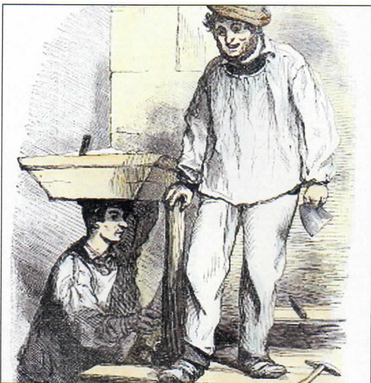
LES MAÇONS. Le manœuvre et le compagnon.

➔ En plus. Ouvrage édité par Les Maçons de la Creuse, 22 €.