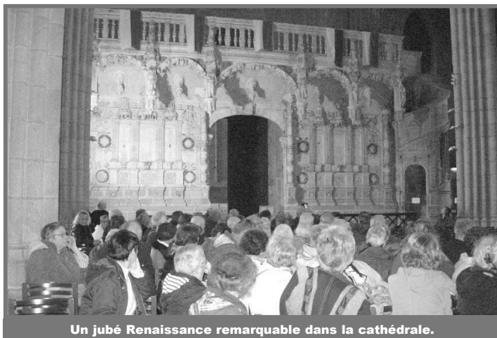
Un jubé Renaissance remarquable dans la cathédrale.