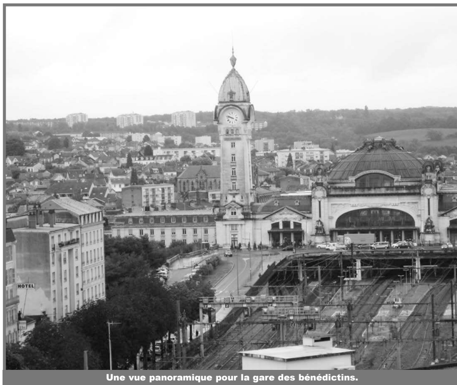
Une vue panoramique pour la gare des bénédictins.