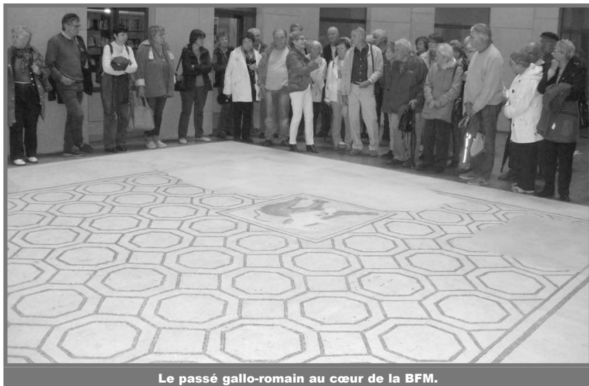
Le passé gallo-romain au cœur de la BFM.