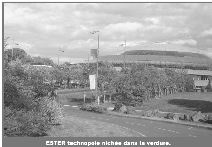
ESTER technopole nichée dans la verdure.