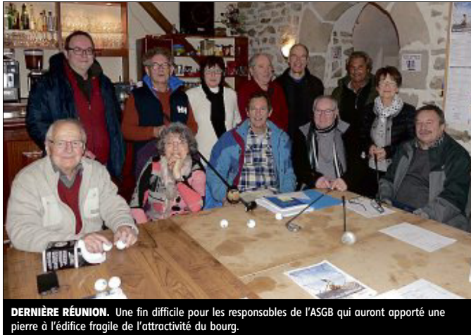
DERNIÈRE RÉUNION. Une fin difficile pour les responsables de l'ASGB qui auront apporté une pierre à l'édifice fragile de l'attractivité du bourg.

Ce clap de fin de l'ASGB est principalement dû à deux problèmes nationaux. D'un côté une baisse de la pratique du golf de près de 18 %. De l'autre, la réforme des emplois aidés. À Bourgneuf, l'association qui a compté jusqu'à 50 licenciés, n'en a