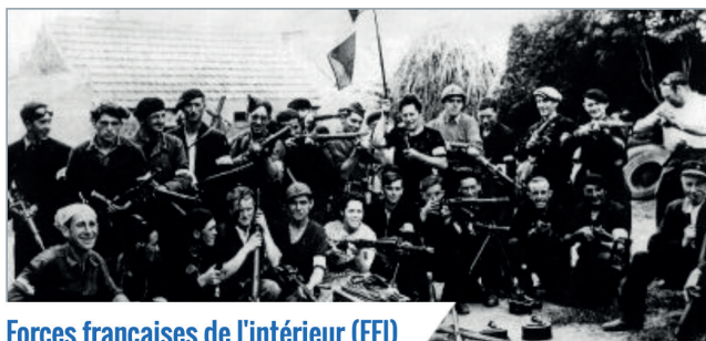
Forces françaises de l'intérieur (FFI)

Dossiers d'homologation qui déterminent l'appartenance de groupements militaires de la Résistance aux Forces françaises de l'intérieur (FFI).