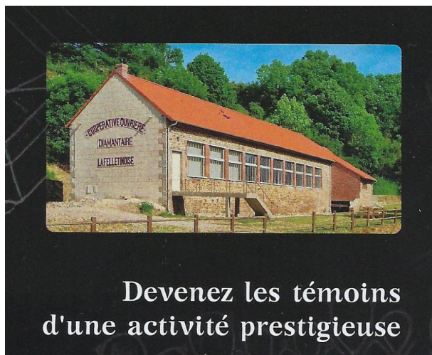
Devenez les témoins d'une activité prestigieuse