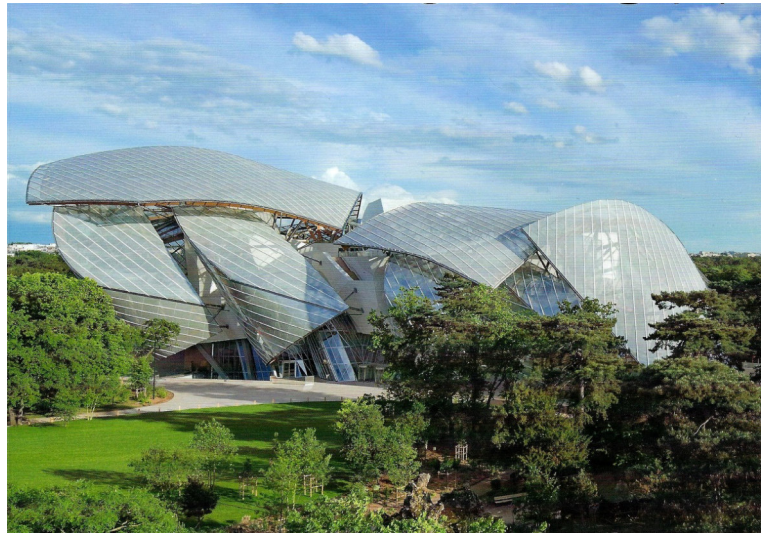
La fondation Louis Vuitton (Groupe LVMH) 8, avenue du Mahatma Gandhi, 75116 Paris Architecte : Franck Gehry