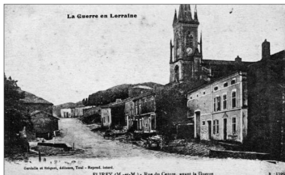
Flirey avant 1914

Situé à proximité de la ligne de front, le village de FLIREY qui comptait 276 habitants avant la guerre, a connu des combats incessants et des bombardements pendant les 4 ans d'hostilités*.