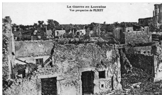
Flirey pendant la guerre

A l'issue du conflit, les maisons étaient réduites à des pans de murs fissurés par les explosions. La reconstruction s'avérait extrêmement coûteuse voire impossible d'autant plus que le site était situé dans un vallon humide.