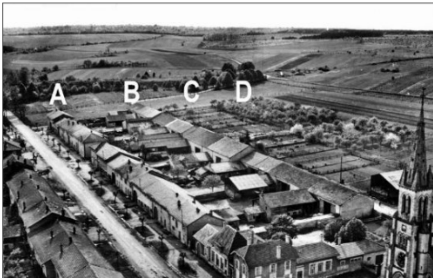
Fig. 4 - Vue aérienne du village reconstruit de Flirey mettant en évidence l'alignement parfait des bâtiments donnant sur la rue principale (A), des bâtiments agricoles situés à l'arrière des cours, desservis par le chemin de défruitement (B), des jardins potagers (C) et des vergers (D).

Alliant tradition, rationalisme et préconisations de l'époque, l'architecte a opté pour une structure caractéristique linéaire des villages-rues lorrains. Les maisons sont disposées en L, avec une place où s'élève l'église dans l'axe. Si les façades ont gardé leur aspect traditionnel, elles sont parfaitement alignées, ce qui n'était pas le cas dans l'ancien village, et à l'arrière de chacune d'elles, une desserte a été créée.